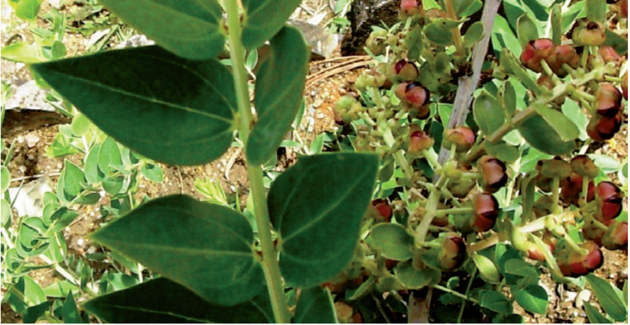
Photo 39 – Redoul: feuilles avec 2 nervures latérales parallèles aux bords.